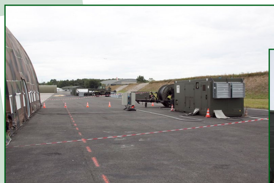
Mise en oeuvre d'une artère haute tension.

Il détient 2 domaines d'expertise uniques qui sont mis à profit dans un cadre interarmées, à savoir le balisage et la filtration NRBC des abris personnel.