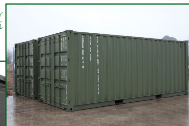
KC20 en partance pour le Mali