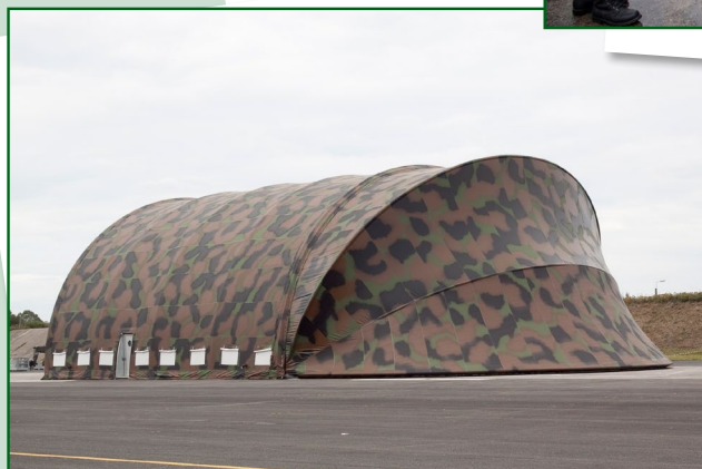
Structure métallo-textile : hangar de maintenance P20.