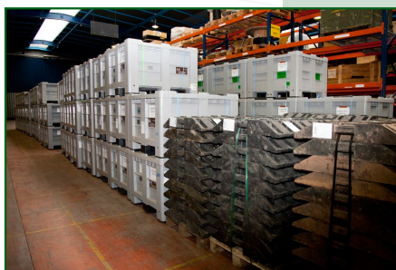
Préparation du matériel avant envoi.

A titre d'exemple, le GAIA a récemment participé à l'opération SERVAL en procédant à l'envoi de 420 tonnes de matériels au Niger afin de mettre en place des bâtiments démontables, et d'assurer la protection dite « passive » des sites (clôtures, miradors). 40 camions remorques double plateau et 27 containers de type KC20 ont ainsi été acheminés vers Toulon par voie routière et ferroviaire. Une dizaine de personnels du GAIA ont chargé la cargaison en 2 jours « de plus de 8 heures ! », deux autres étaient partis en reconnaissance. Le montage est assuré sur place par le GAAO.