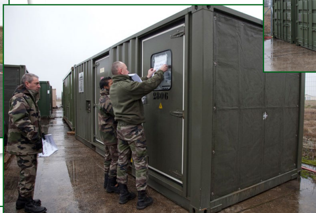
MCO des groupes électrogènes.